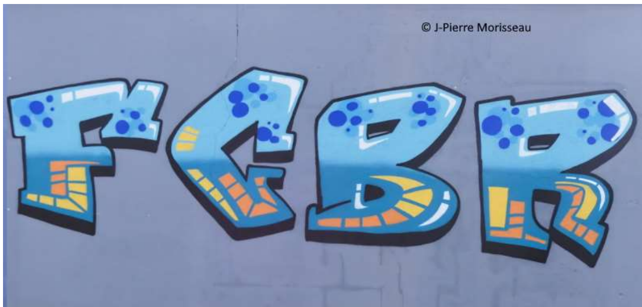
Football Club Bouaine Rocheservière